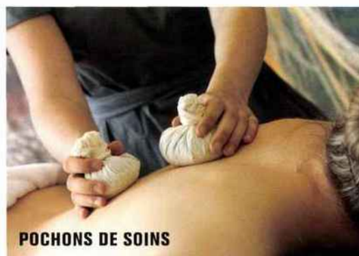
POCHONS DE SOINS