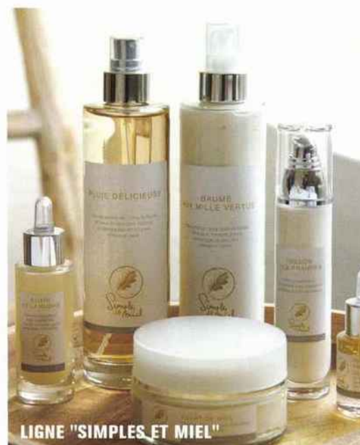
LIGNE "SIMPLES ET MIEL"