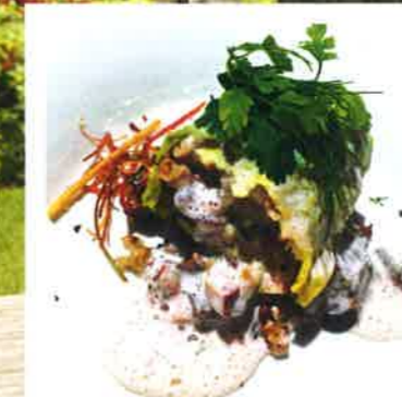
▼ En habit de chou vert : tofu, flocons d'avoine torrifiés, boulgour, orge perlé, légumes et lentilles bio