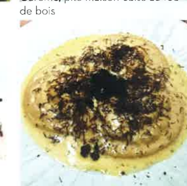
▼ Le blanc-à-fromage d'Alsace et truffes noires en ravioles de pâte fraîche, beurre blanc au parmesan