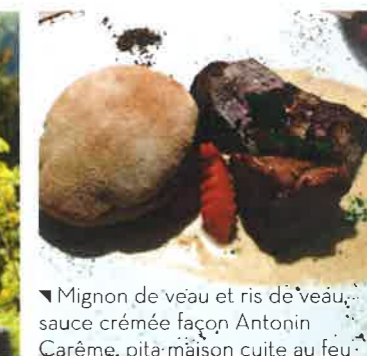
▼ Mignon de veau et ris de veau, sauce crémée façon Antonin Carême, pita maison cuite au feu de bois